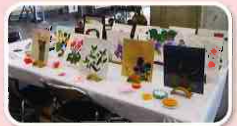
折り紙同好会による作品の展示

コロナ禍のため、今年度はコーヒーの接待は中止とし、 リフォーム同好会、折り紙同好会による作品の展示・販売のみ実施しました。