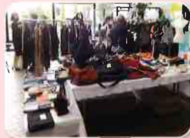
ソーイング・リフォーム同好会「もみじの会」による作品の展示・販売